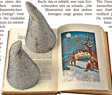
Sam Tho Duongs „7 Zwerge“-Objekte.

kornperlen besetzt sind. Und wie der Zufall es will, sollen diese beiden Objekte eine ganz besondere Präsentationsform bekommen. „Zurück in Pforzheim, habe ich im Internet ein Märchenbuch bestellt, das als Podest für die Mützen ausgehöhlt werden sollte“, schildert der 46-Jährige. Doch das Buch, das er erhielt, war zum Zerschneiden viel zu schade: „Die Illustration zeigt den sieben Zwergen zeigt genau zwei